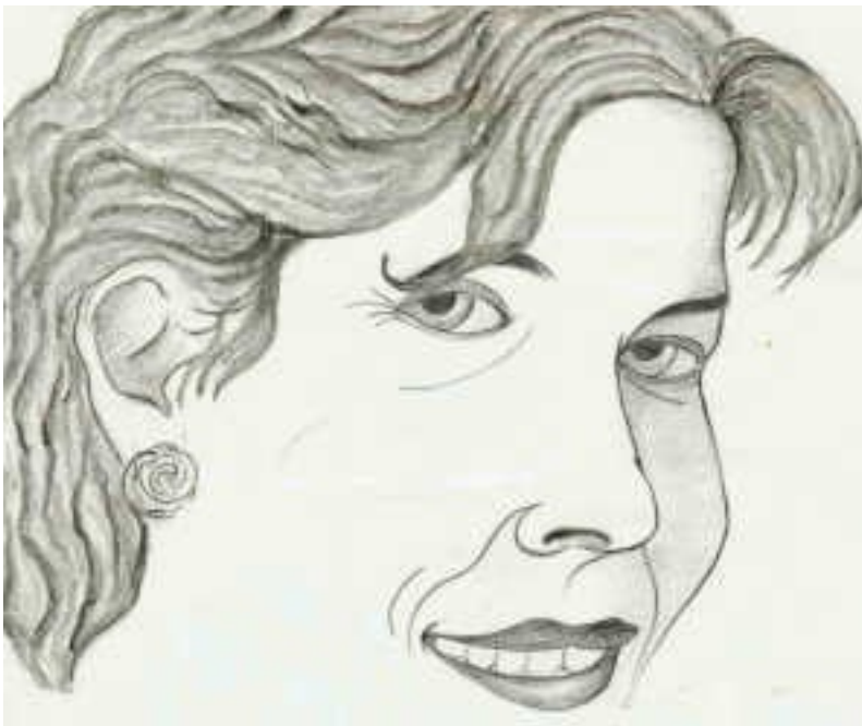
Grafik: Peter Krullis

So entstand ein Kaleidoskop von Frauengeschichten mit ganz persönlichen gefühlsgeladenen Begegnungen, in denen auch der Mann eine Rolle spielt.