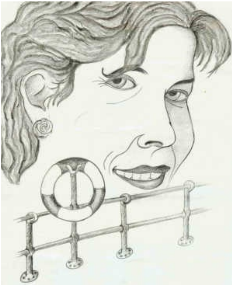
Grafik: Peter Krullis

Auftrittstermine im Rahmen der Schultheatertage am LTT: